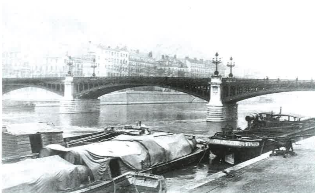
Le pont d'Ainay, construit en 1899, détruit en 1944, et non reconstruit.