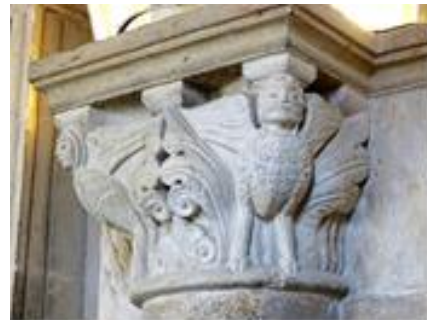
11 – 12 – 13 chapiteaux romans