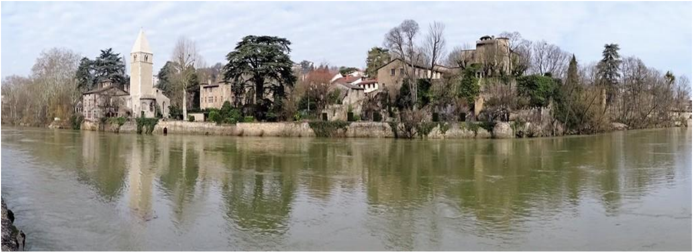
01 – vue panoramique de l'Ile Barbe