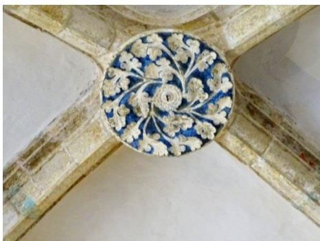
14 – clé de voute avec rosace