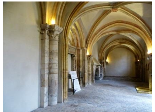
10 – Travée de la chapelle