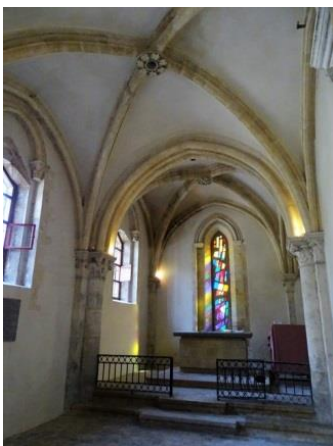
08 – Chapelle Ste Catherine