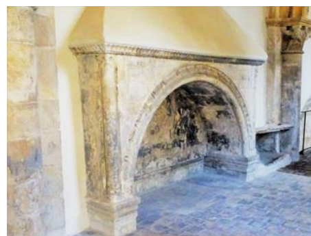
16 - enfeu