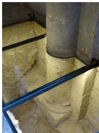
15 – socle enterré sous le pavage