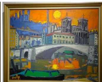
22 – 23 - Toiles de Jean Couty