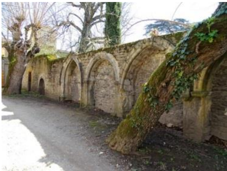
05 – Vestige du Cloître