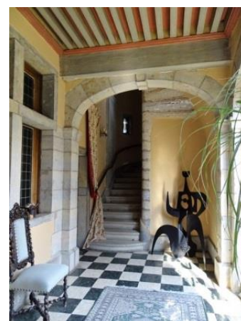
19 – intérieur de la Prévôté