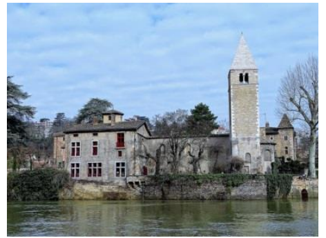
04– Chapelle Notre Dame