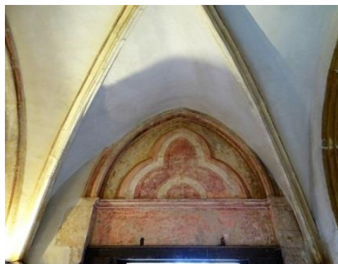
09 - Chapelle Ste Catherine