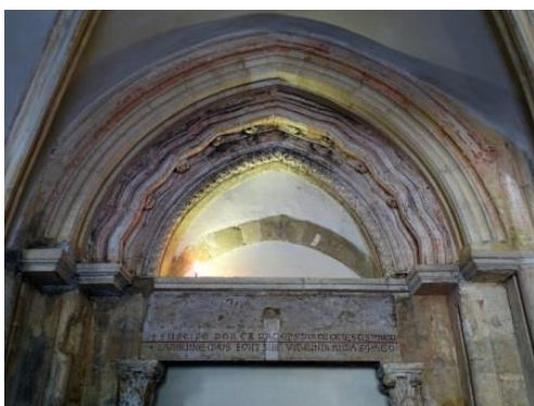
17 – tympan