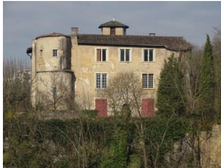
03 - Le Chatelard