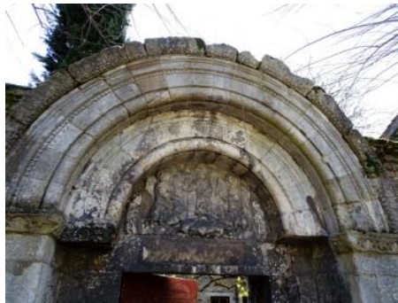
06 - Vestiges église St Loup