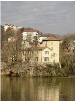
02 - Priuré Ste Anne