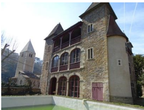
18 – la Prévôté