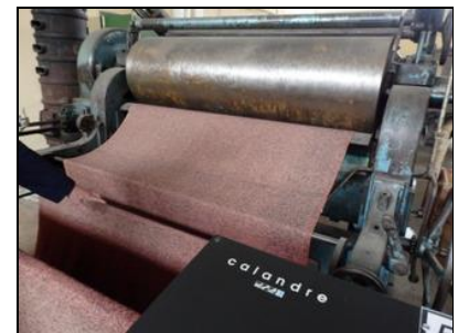
Musée de la Draperie (métier à tisser, Copseuse et Calandre)