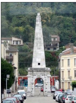
Pyramide du cirque romain