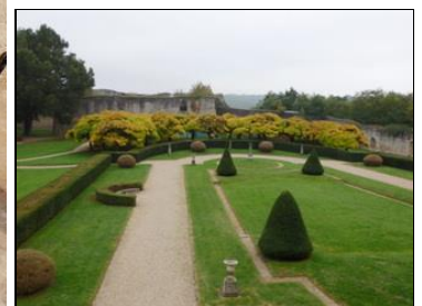
Le château de Septème, son puits et ses jardins